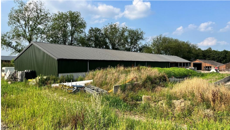
Afbeelding 2: het dak van Guus van Roessel waar straks onze zonnepanelen komen te liggen